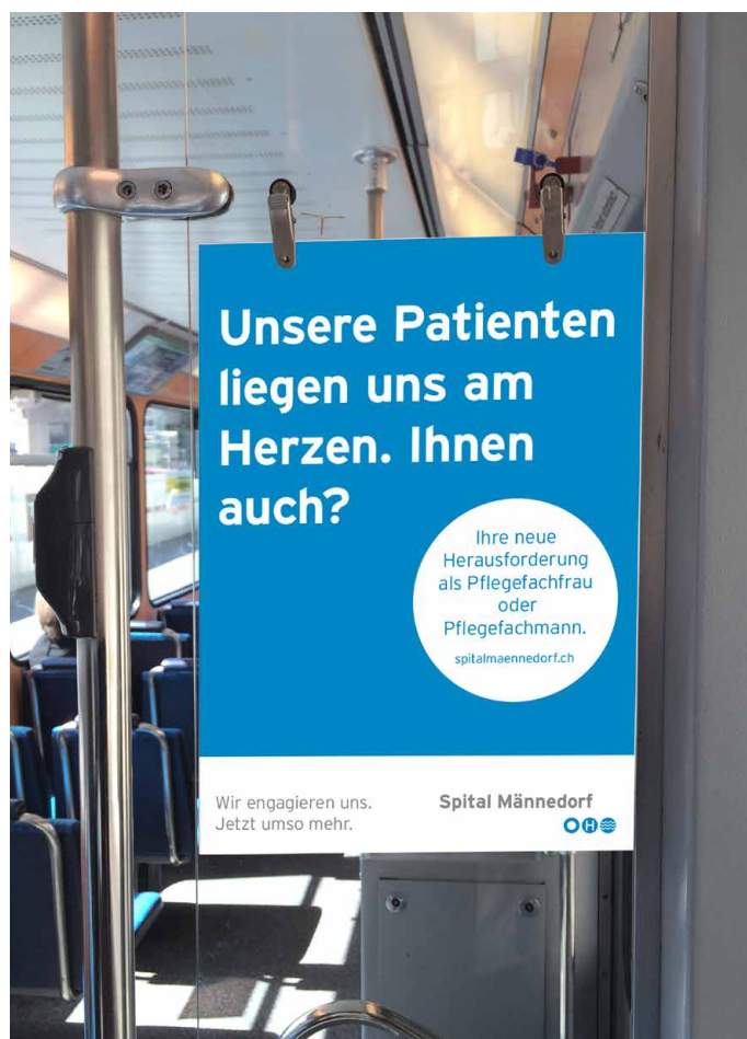
HR-Kampagne erste Phase Aushang öffentliche Verkehrsmittel