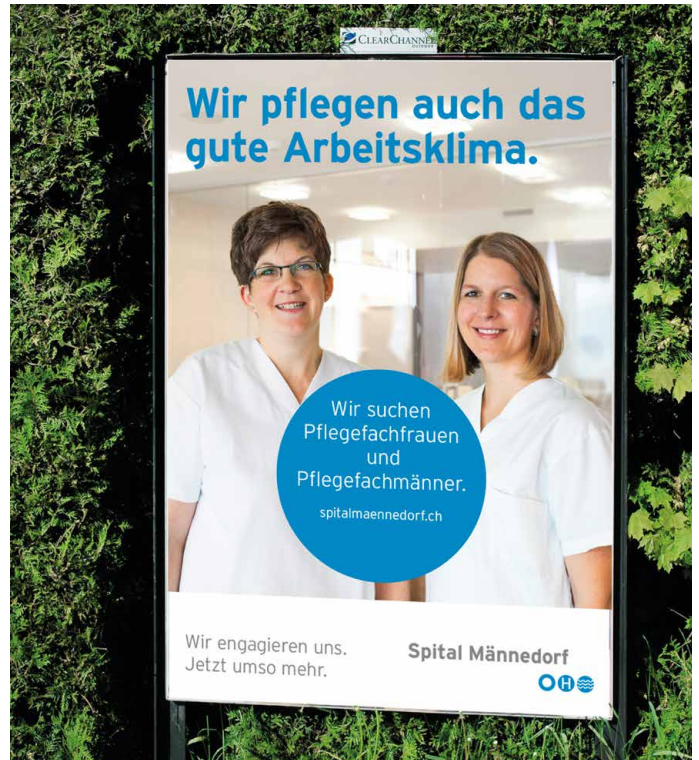
HR-Kampagne zweite Phase Aushang öffentliche Verkehrsmittel, Bannerwerbung, Plakate und Inserate