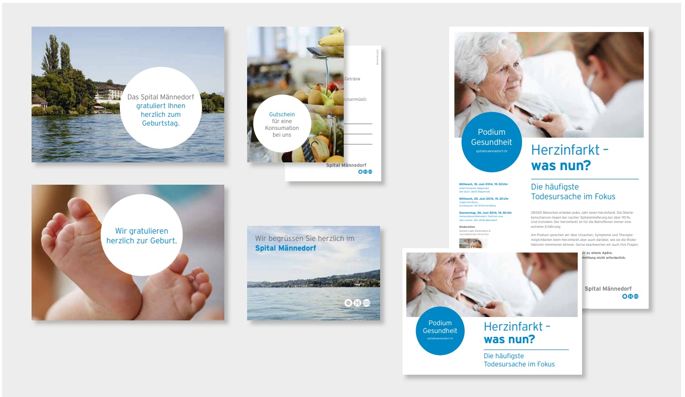
Auswahl an Kommunikationsmitteln