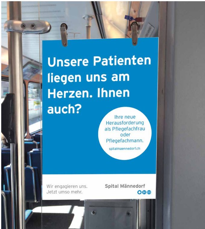
HR-Kampagne erste Phase Aushang öffentliche Verkehrsmittel