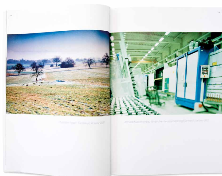
2006 Die vorallem im Bereich Maschinen und Anlagebau starke Holding thematisiert in den Bildkompositionen den dialektischen Bezug zwischen Landschaftsbildern und industriellen Produktionsstätten an verschiedenen Standorten.